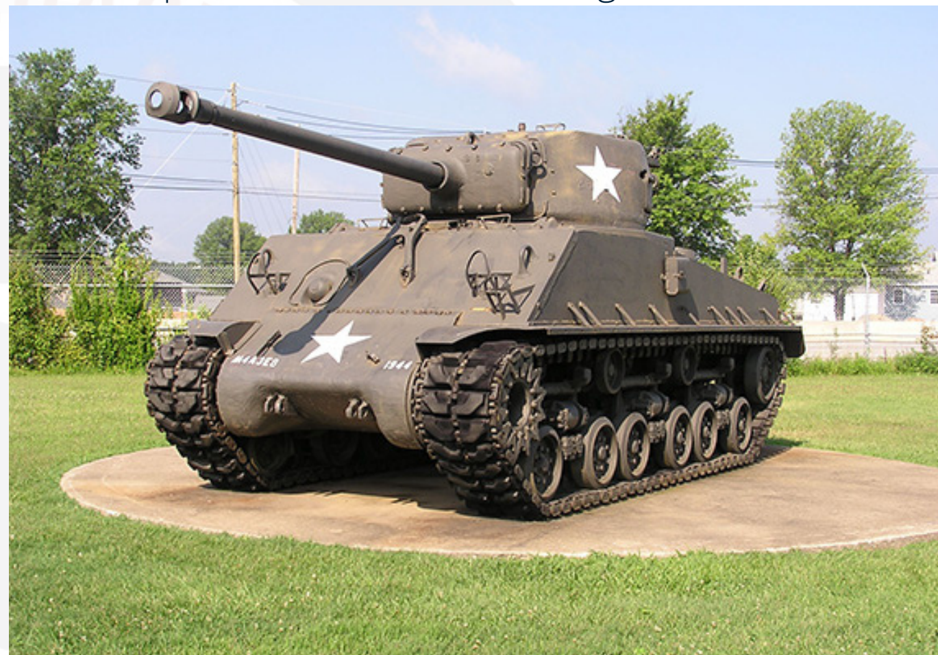
https://wargaming.com/en/news/battle_castle_itter/ Le char Sherman Besotten Jenny

Après cela, les préparatifs de défense commencent. Le char Sherman est placé devant l'entrée du château et sa mitrailleuse est déplacée sur le toit de la porte d'entrée pour avoir un meilleur angle de tir.