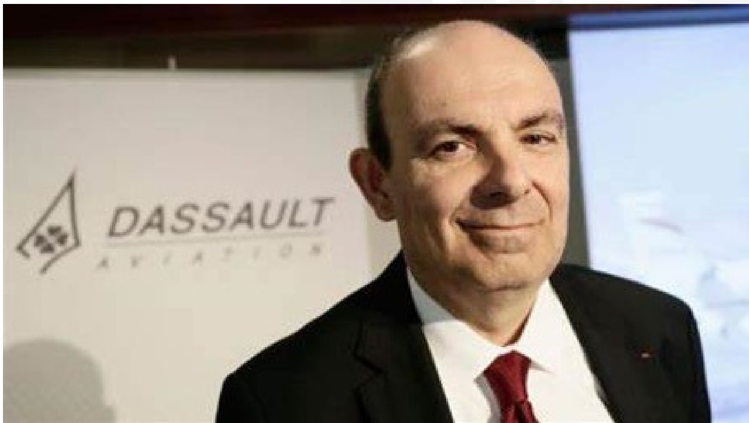
Eric Trappier, DG de DASSAULT Aviation

D'un point de vue spatial, il ne s'impose pas moins en tant qu'enjeu stratégique de demain, français comme européen. Concrètement, selon Joël Barre, la France prévoit le lancement du renouvellement des capacités en matière d'observation optique, d'écoute électromagnétique et de télécommunications.