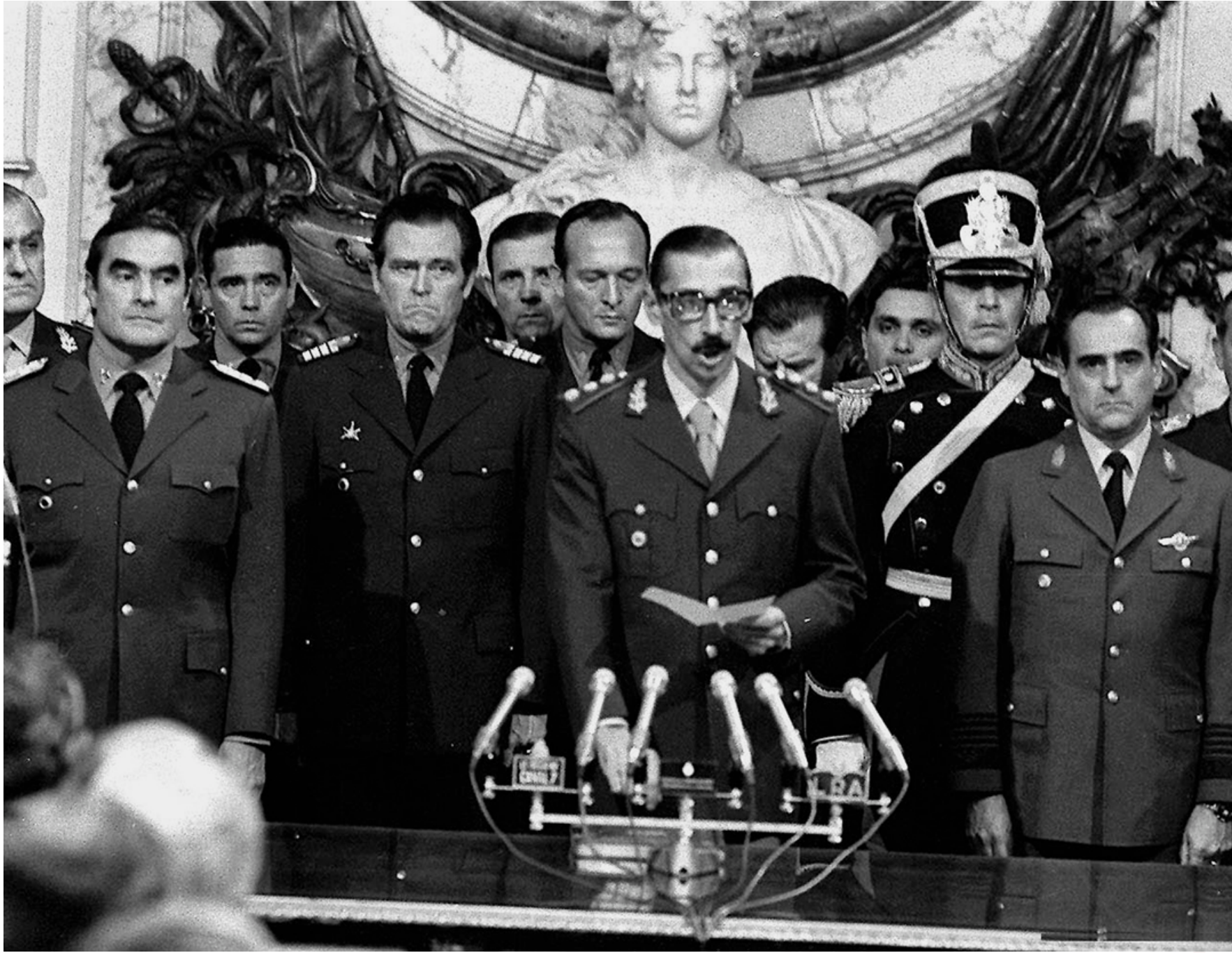
Jorge Rafael Videla is sworn in as president of the military junta in Argentina in 1976

Si sur le court terme, l'archipel retrouva ses couleurs anglaises, les conséquences politiques et économiques du conflit eurent des répercussions à bien plus long terme pour les deux pays.