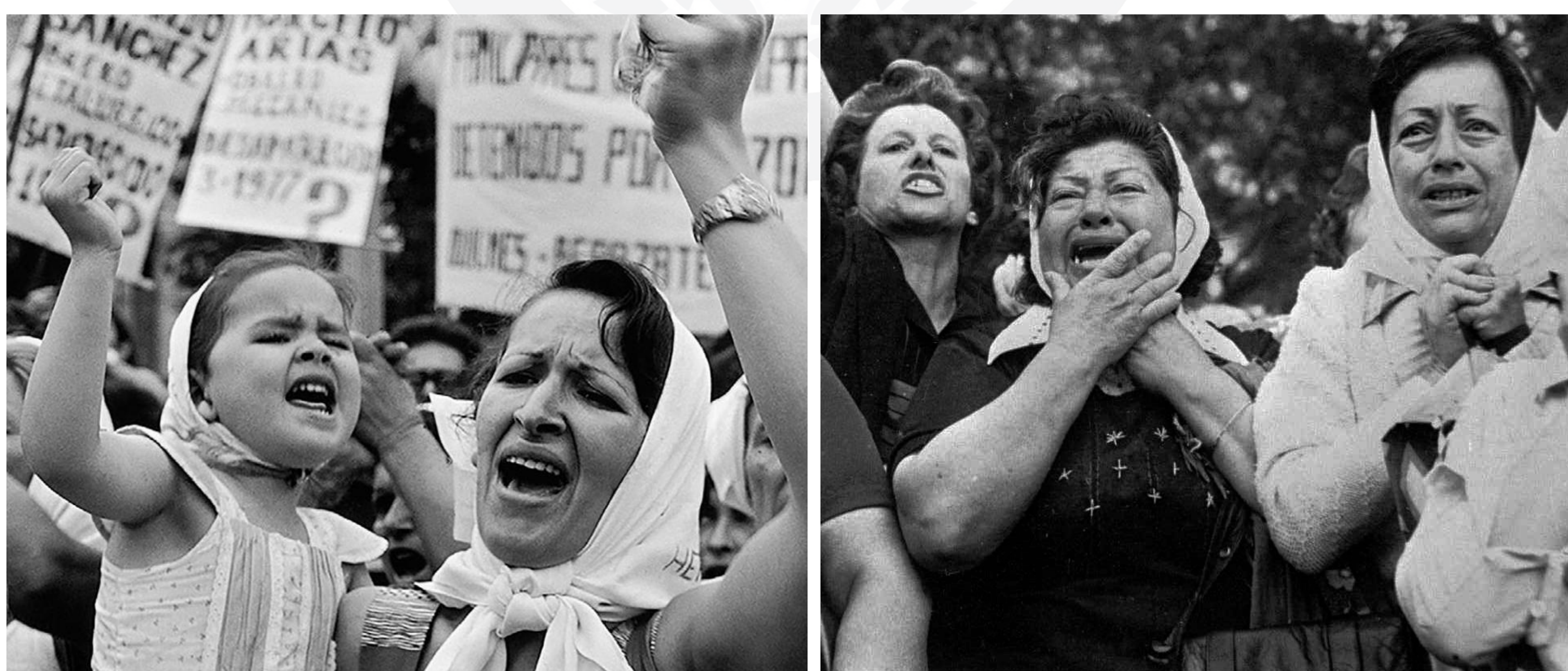
los madres de la plaza de mayo, les Times. 11 May, 2011

La guerre a également conduit à une crise économique sans précédent dans le pays, avec une hausse des taux d'inflation et une chute de la monnaie. La guerre a coûté à l'Argentine plus de 11 milliards de dollars et a entraîné un effondrement de la production industrielle. La défaite a également eu des conséquences diplomatiques pour l'Argentine. La communauté internationale a condamné l'invasion des îles par l'Argentine et a soutenu le Royaume-Uni dans la défense de son territoire. Des sanctions internationales prises à l'encontre de Buenos Aires ont été très préjudiciables à l'économie argentine déjà fragile. Le pays a perdu sa crédibilité internationale et est devenu un paria diplomatique. Cela a entravé les efforts de l'Argentine pour s'engager dans des négociations avec d'autres pays et ses relations diplomatiques sont restées tendues pendant de nombreuses années.