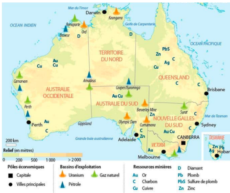
CARTOGRAPHIE DES RESSOURCES NATURELLES EN AUSTRALIE

Répression des militants écologistes : Alors que la croissance australienne repose en partie sur des secteurs très polluants, comme le secteur minier, la société australienne se polarise de plus en plus sur la place à donner à l'écologie. Plusieurs États se sont alors dotés de lois réprimant sévèrement les actions et manifestations entravant ces activités. D'une part, le travail de nombreux Australiens en dépend. D'une autre, l'Australie et l'Océanie en général sont l'une des régions les plus touchées par les effets du dérèglement climatique.